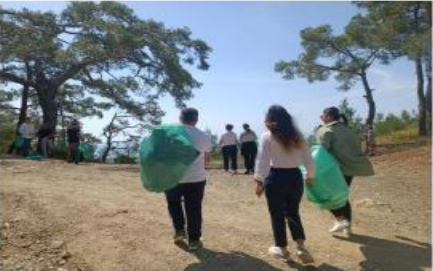
Levent YENİGÜN/KEMER, (DHA)